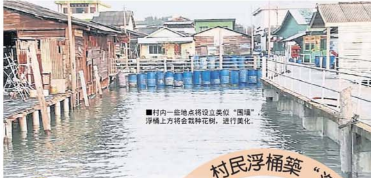
■村内一些地点将设立类似“围墙”，浮桶上方将会栽种花树，进行美化。