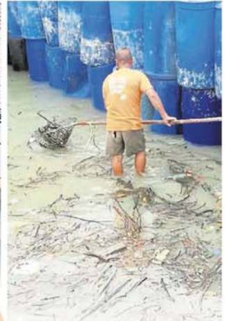
■一旦垃圾漂到海闸处，便无法进入村内，村民过后便把隔挡在外的垃圾捞走。