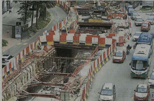
武吉免登城市中心的地下隧道工程有望在今年杪或明年1月竣工，同时恢复通车。

他表示，口才对各行各业都非常重要，不仅是政治人物或生意人，在谈话或沟通方面都起着重要的作用。