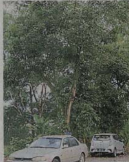
市議會砍樹近一个月没有善后，让居民感到不满。

“我对市議會的做法感到不解，砍樹和清理樹干应是同一套工作，为何工作只做一半便置之不理，让居民承受后果？如今樹干已被晒得枯黄，我担心有露天焚烧习