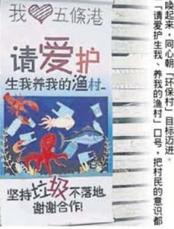
■全村將有約130公尺長的“圍牆阻隔法”，讓外來垃圾通通都漂不進村內。