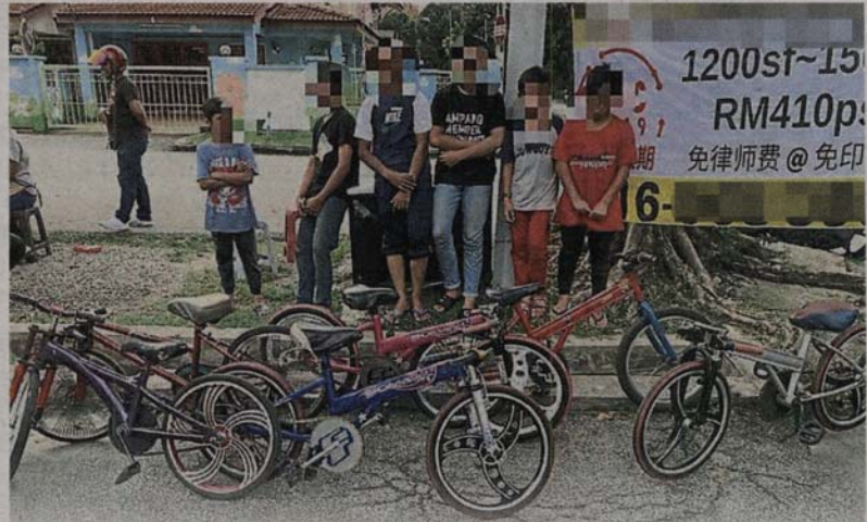
■6名少年因在在安邦区危险骑乘非法改装脚车，被警方发现而将他们扣留调查。

(安邦再也11日讯) 6名年龄介于11至16岁的少年，因在安邦区危险骑乘非法改装脚车，结果被警方发现他们危险骑车，将他们扣留调查。同时，警方也以疏忽照顾的角度逮捕这6名少年的父母，一旦罪成，罚款最高5000令吉，或坐牢不超过2年，或两者兼施。