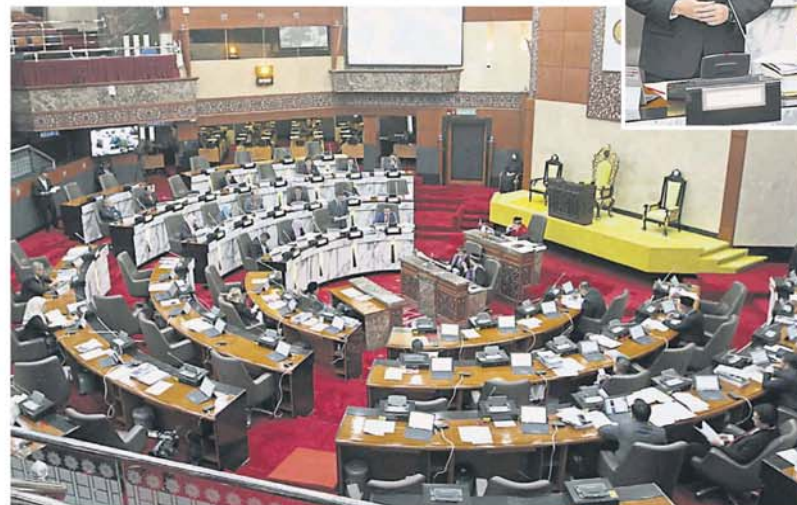
雪州立法议会上午时段约有 10 位议员没有出席。