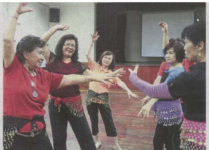
Special halls can be used for the benefit of the elderly.

“Our Menteri Besar has proposed that developers provide a space for the elderly to carry out their daily activities.”