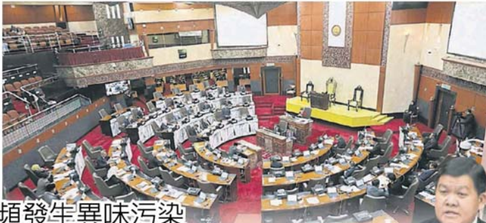
■早上8点的口头条闻环节，许多州议员尚未抵达而错过雪州议会第14届第2季第3次会议进入第二周。