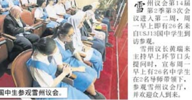
■來自USJ 13的國中生參觀雪州議會。